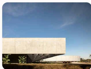
CHURCH OF THE HOLY FAMILY Brasilia, Brazil ARQBR Arquitetura e Urbanismo