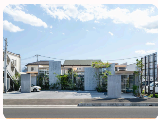
HAIR ROOM TOARU Hanno, Japan Ateliers Takahito Sekiguchi