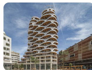
HIGHER ROCH Montpellier, France Brenac & Gonzalez & Associés