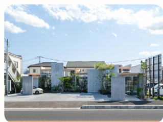
HAIR ROOM TOARU Hanno, Japan Ateliers Takahito Sekiguchi